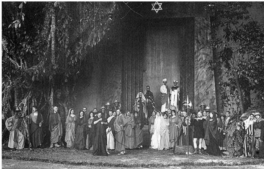
De eerste openluchtvoorstelling van Judas Ish Kariot in Nederlands-Indië door het Tooneel Ensemble Louis de Vries, 1915. [Theatercollectie, Bijzondere Collecties UvA]

se uniformen op het toneel te dragen. Wel kwam het publiek massaal af op de eerste openluchtvoorstelling in Nederlands-Indië van Judas Ish-Karioth , een toneelstuk van Jan Walsch waarin deze een psychologische uitbeelding geeft van de aanleiding tot Judas' verraad.